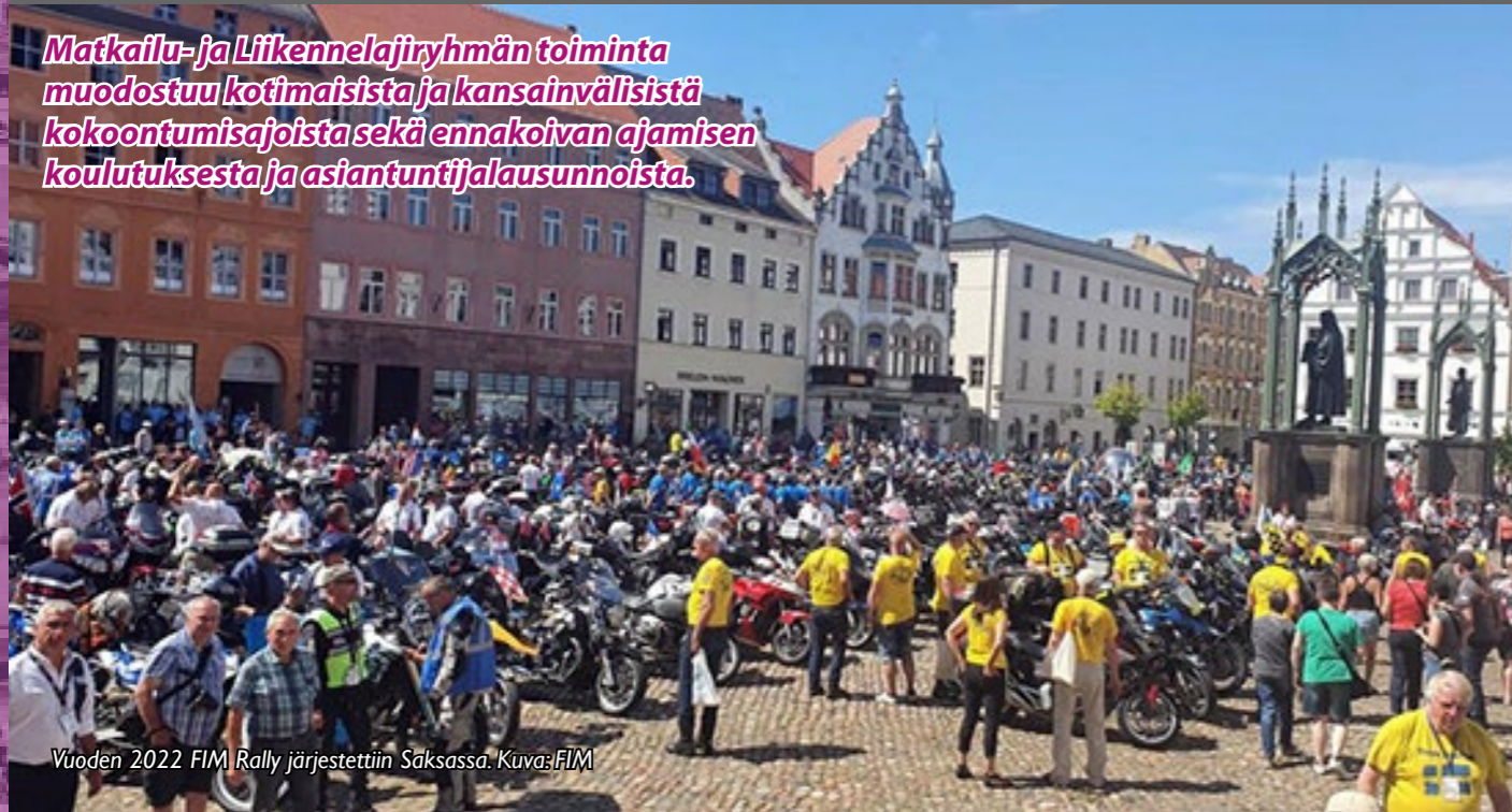
Vuoden 2022 FIM Rally järjestettiin Saksassa.

Matkailu- ja Liikennelajiryhmän toiminta muodostuu kotimaisista ja kansainvälisistä kokoumisajoista sekä ennakoivan ajamisen koulutuksesta ja asiantuntijalausunnoista.