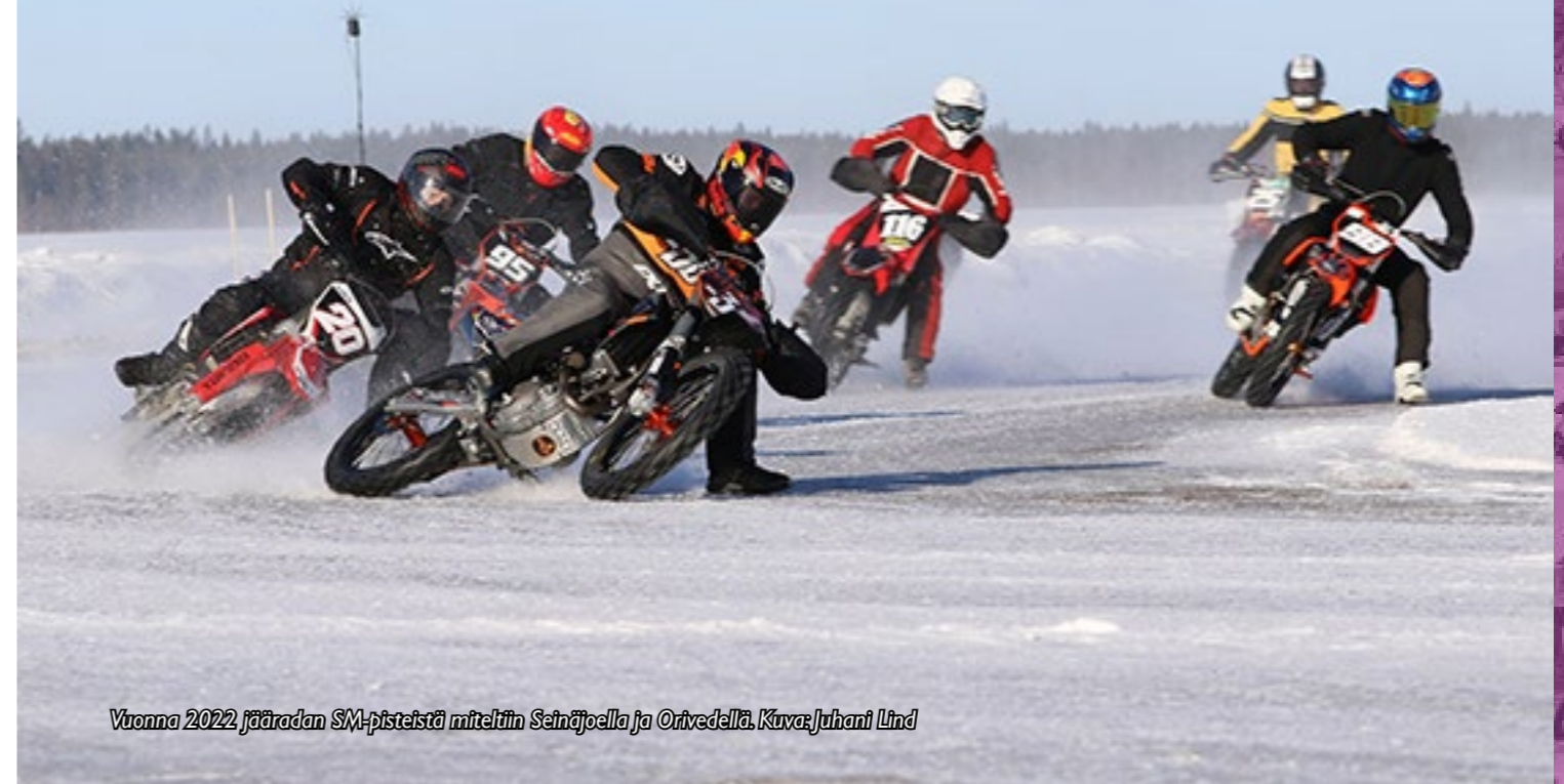
Vuonna 2022 jääradan SM-pisteistä miteltiin Seinäjoella ja Orivedellä.

Jäärataa ajetaan suljetulla radalla motocross-moottoripyöriin perustuvilla ja erikoisnastoitetuilla renkailla varustetuilla ajokeilla. Lajille ominainen piirre on, että lähtöviivalla kohtaavat eri moottoripyörelajien edustajat.