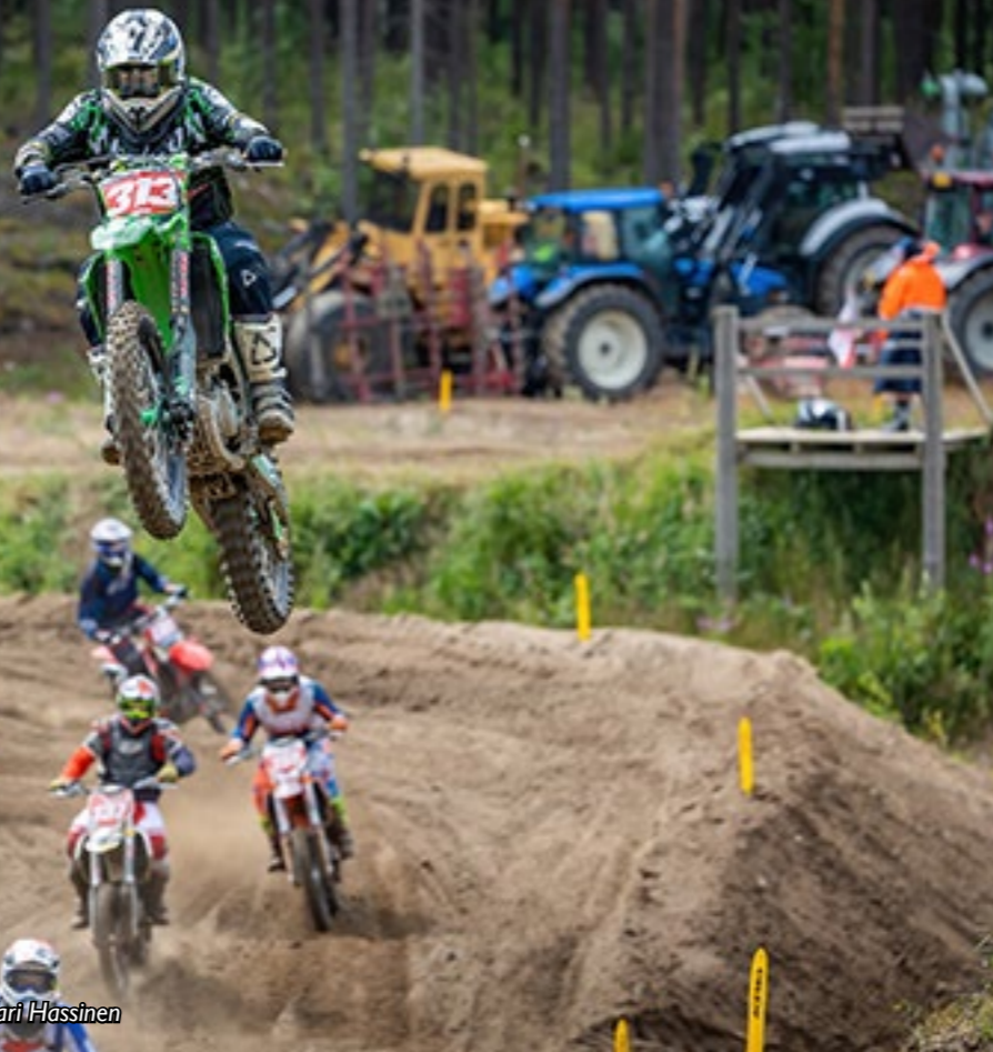
Motocrossin harrastajamäärät nousivat vuonna 2022.

Motocross on suljetulla kilpailualueella ajettava laji, jossa kisataan luonnonmukaisella alustalla ja johon kuuluvat hyppyrit, urat sekä ylä- ja alamäet.