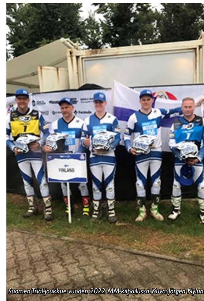
Suomen Trial-joukkue vuoden 2022 MM-kilpailussa.

Valmennustapahtumat on saatu koronan jälkeen taas käyntiin ja osanotto tapahtumissa on ollut erittäin hyvä.