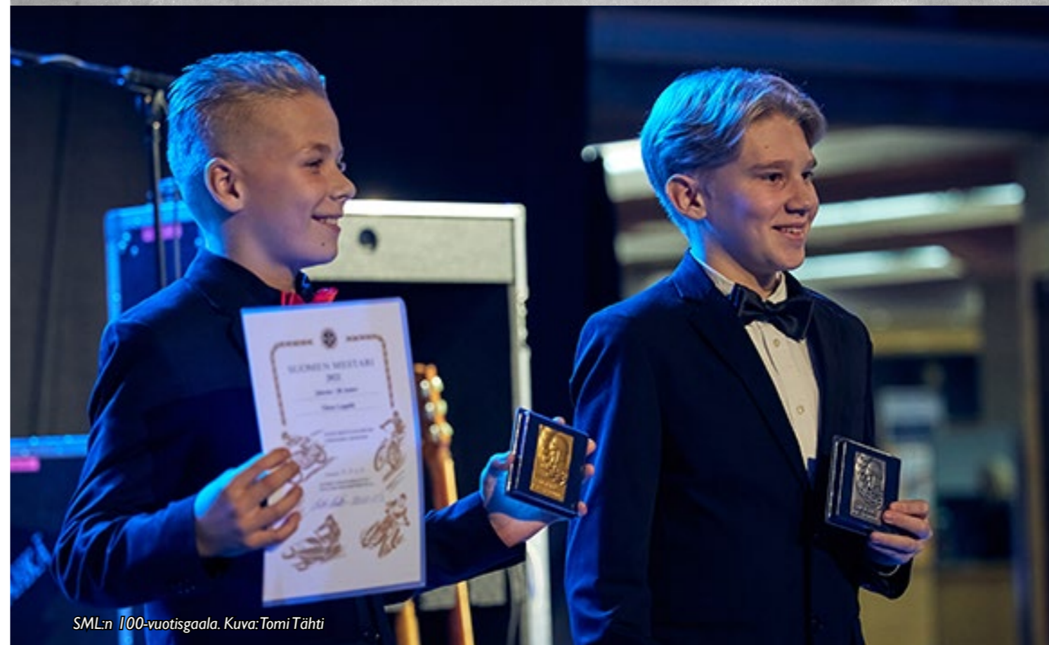
SML:n 100-vuotisgaala.