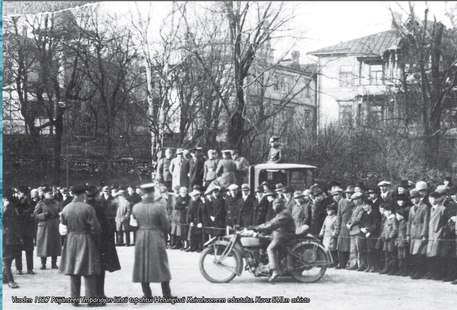
Vuoden 1927 Pääjanteen Ympäriajon lähtö tapahtui Helsingissä Katuhuoneen edustalta.