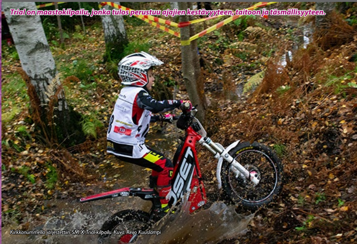
Kirkkonummella järjestettiin SM X-Trial-kilpailu.

Trial on maastokilpailu, jonka tulos perustuu ajajien kestävyYTEEN, taitoon ja täsmällisyyteen.