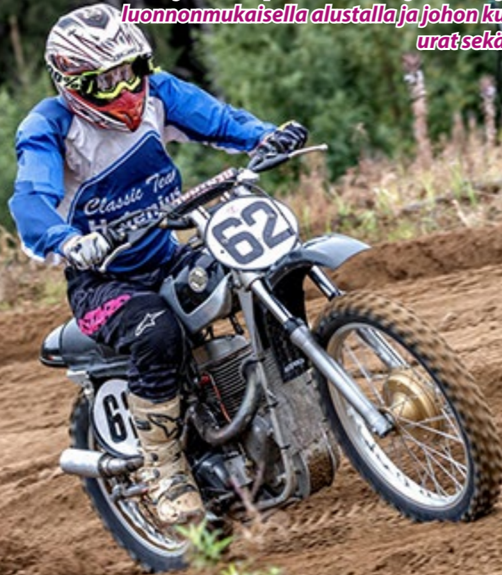
Vuonna 2022 Suomessa ajettiin viisi Classic Motocross -kilpailua.

Classic Motocross on Classic-moottoripyörillä suljetulla kilpailualueella ajettava laji, jossa kisataan luonnonmukaisella alustalla ja johon kuuluvat hyppyrit, urat sekä ylä- ja alamäet