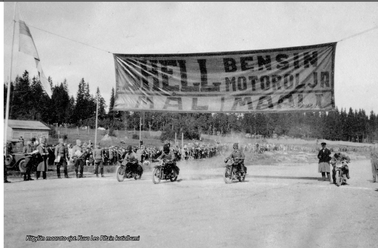
Käpylän maarata-ajot.