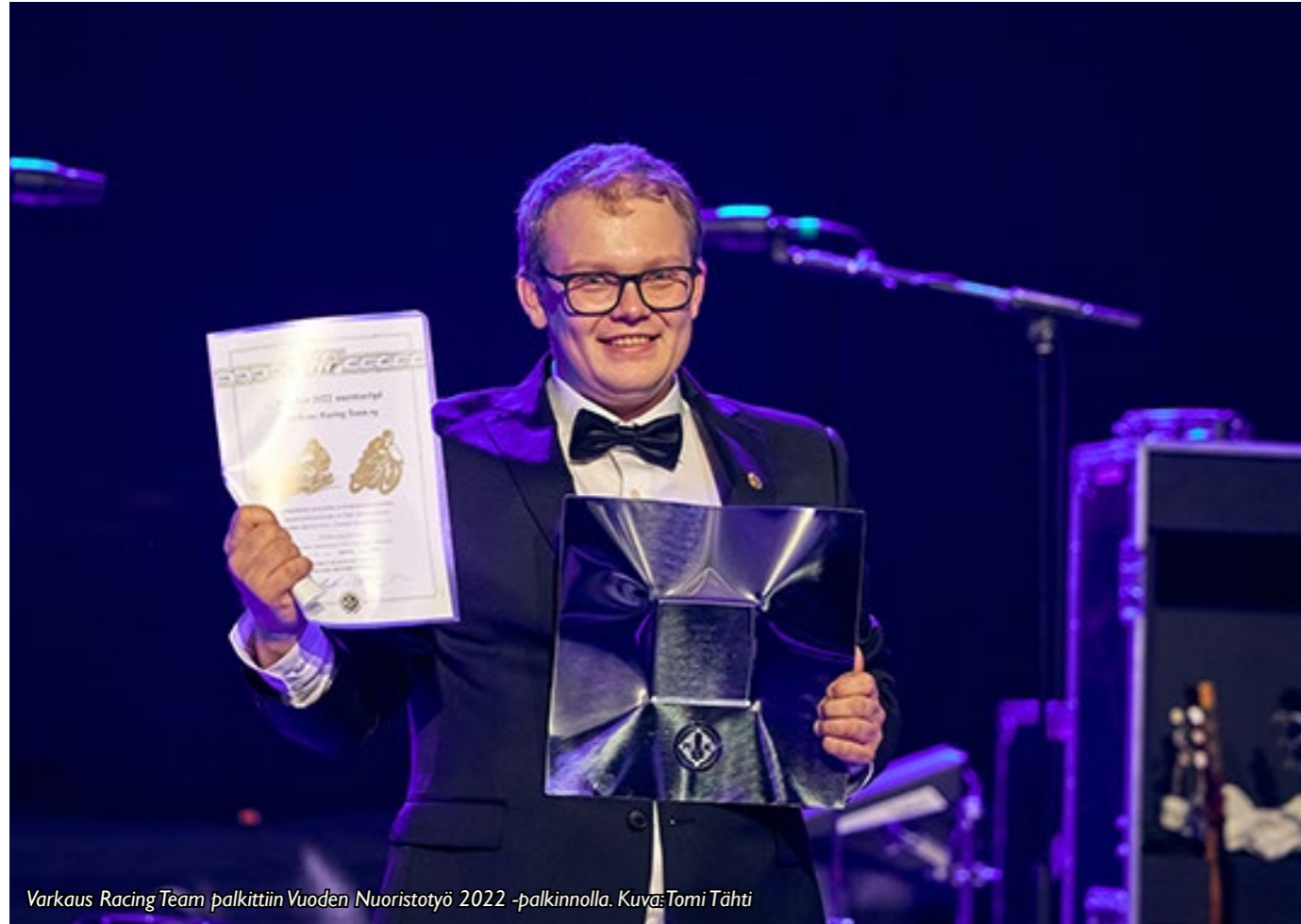
Varkaus Racing Team palkittiin Vuoden Nuoristotyö 2022 -palkinnolla.