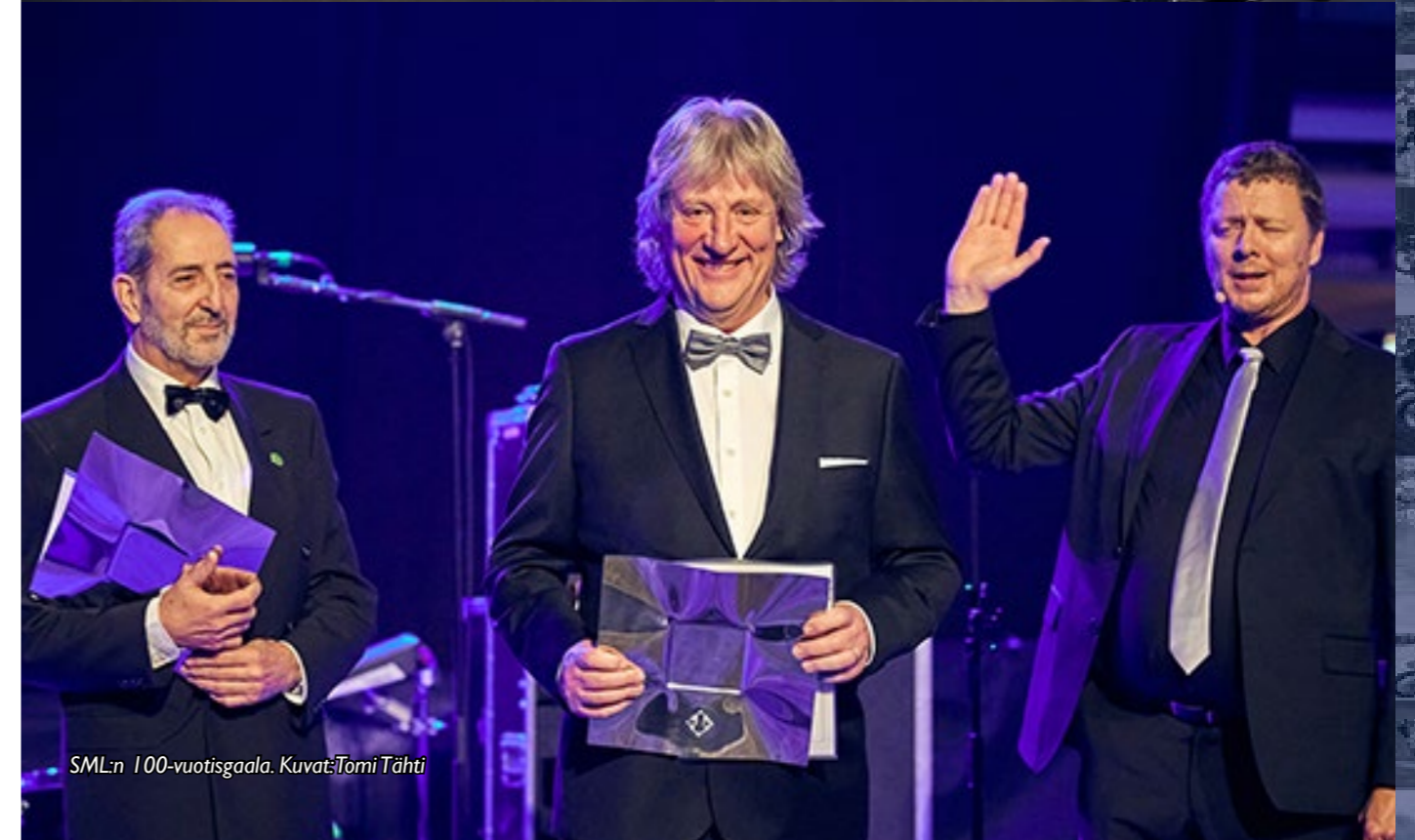
SML:n 100-vuotisgala.