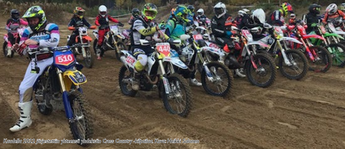
Kaudella 2022 järjestettiin yhteensä yhdeksän Cross Country -kilpailua.

Cross Country on maastossa ajettava pitkäkestoinen reittikestävyyskilpailu, joka on pääpiirteissään Motocrossin ja Enduron yhdistelmä.