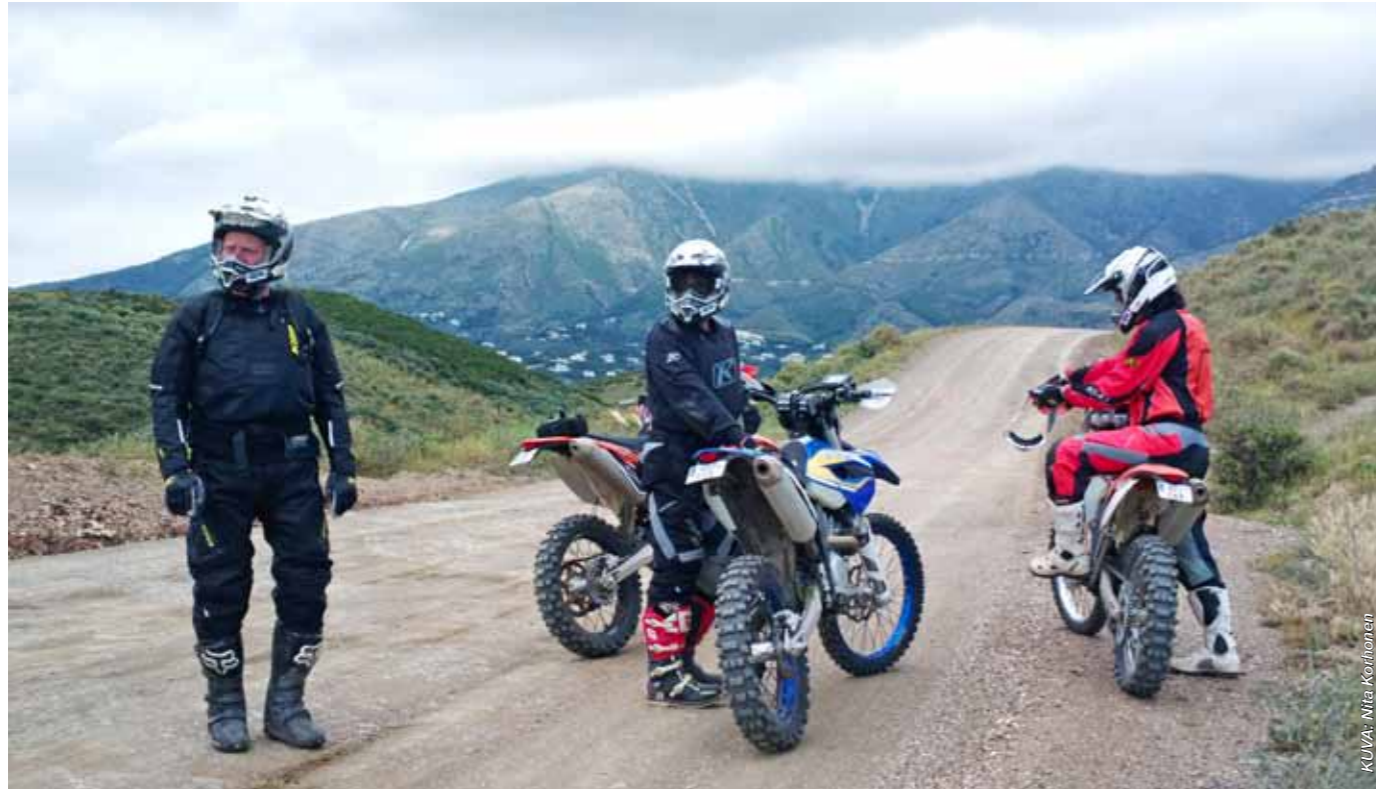
Myös endurolegenda Kari Tiainen osallistui aktiivisesti nuorten kuljettajien valmennustoimintaan.

Valmennusta toteutettiin uudistetun valmennusstrategian suunnassa. Valmennustoiminnan runko pysyi edellisvuosien kaltaisena, mutta rahoitusmalli suuntautui maajoukkueiden sijasta enemmän yksilövalmennukseen ja tasoltaan parhaimpiin nuoriin.