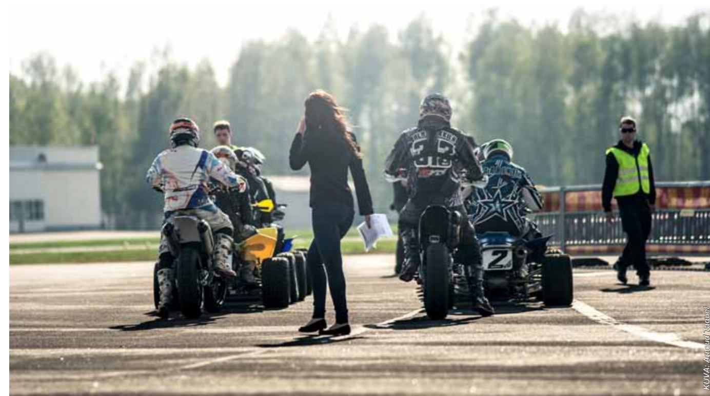
Supermoto ja ATV Supermoto esittäytyi yli 10000 katsojalle Malmin Air&Motor Show Live -tapahtumassa.