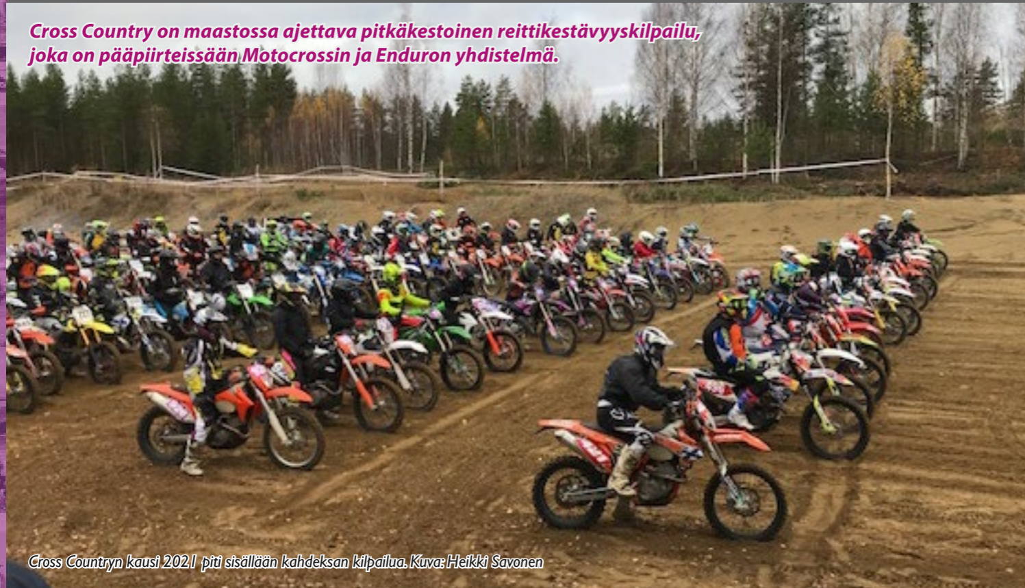
Cross Countryn kausi 2021 piti sisällään kahdeksan kilpailua.

Cross Country on maastossa ajettava pitkäkestoinen reittikestävyyskilpailu, joka on pääpiirteissään Motocrossin ja Enduron yhdistelmä.