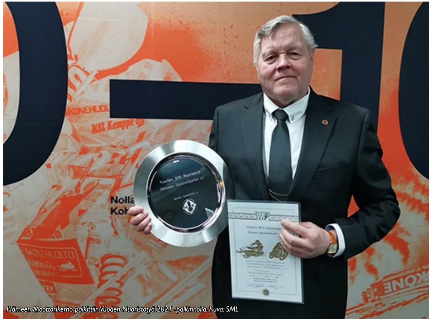
Hämeen Moottorikerho palkittiin Vuoden Nuoristotyö 2021 -palkinnolla.