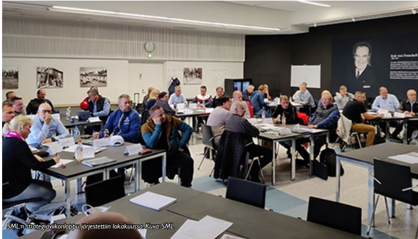
SML:n strategiaviikonloppu järjestettiin lokakuussa.

tuvia henkilöitä oli edelleen normaalivuotta vähemmän, joskin määrät nousivat vuodesta 2020. Tilanteeseen vaikuttaa edelleen SML:n toimiston henkilöstörakenne sekä koronan aiheuttamat kokoontumisrajoitukset.