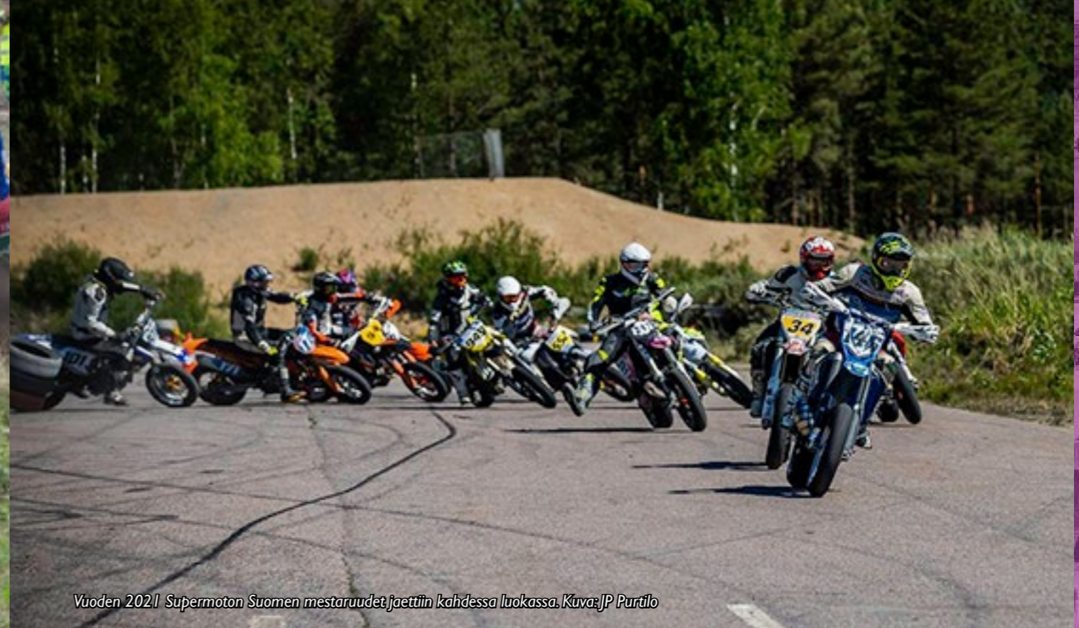
Vuoden 2021 Supermoton Suomen mestaruudet jaettiin kahdessa luokassa.

Supermoto on yhteislähdöllä tapahtuva nopeuskilpailu, joka ajetaan suljetulla ja osittain tai kokonaan päällystetyllä radalla.