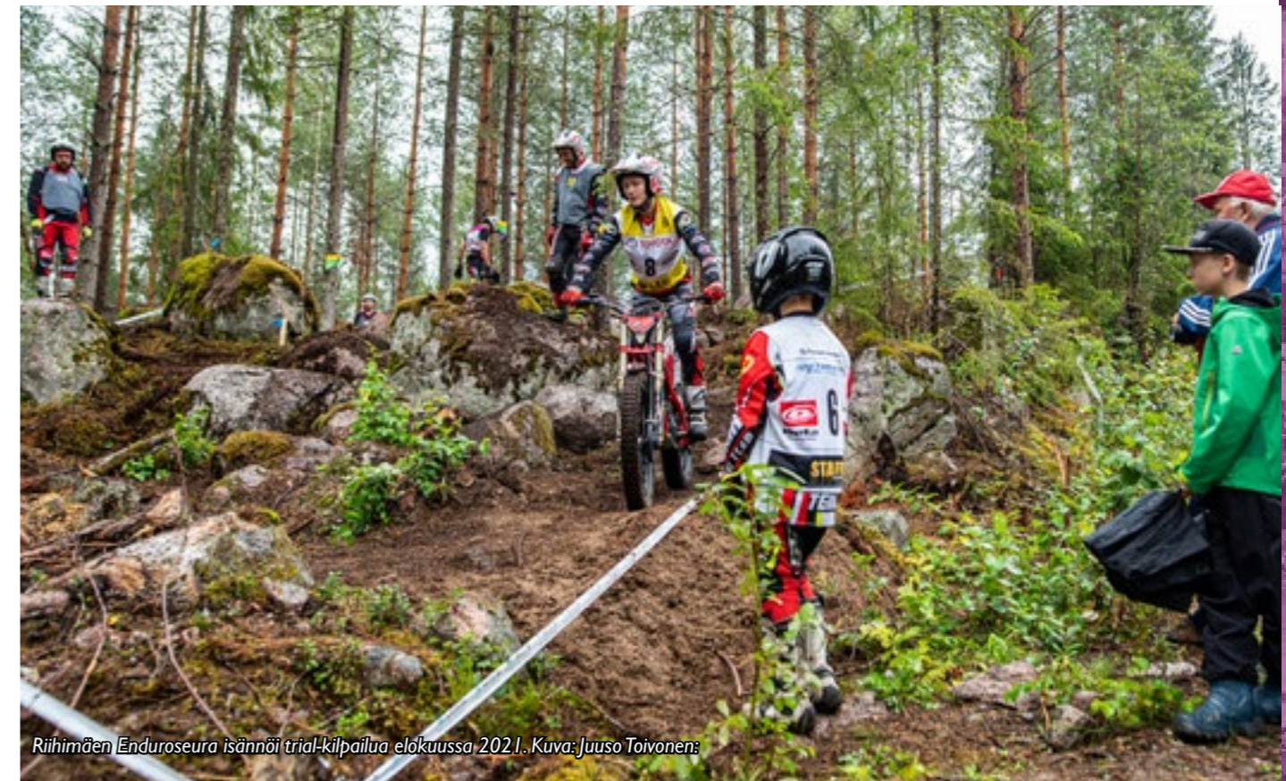
Riihimäen Enduroseura isännöi trial-kilpailua elokuussa 2021.

Valmennustapahtumia ei pidetty kaudella 2021 vallitsevan koronatilanteen takia.