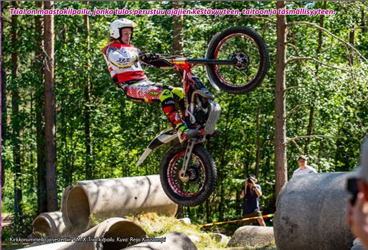
Kirkkonummella järjestettiin SM X-Trial-kilpailu.

Triäl on maastokilpailu, jonka tulos perustuu ajajien kestävyteen, taitoon ja täsmällisyyteen.