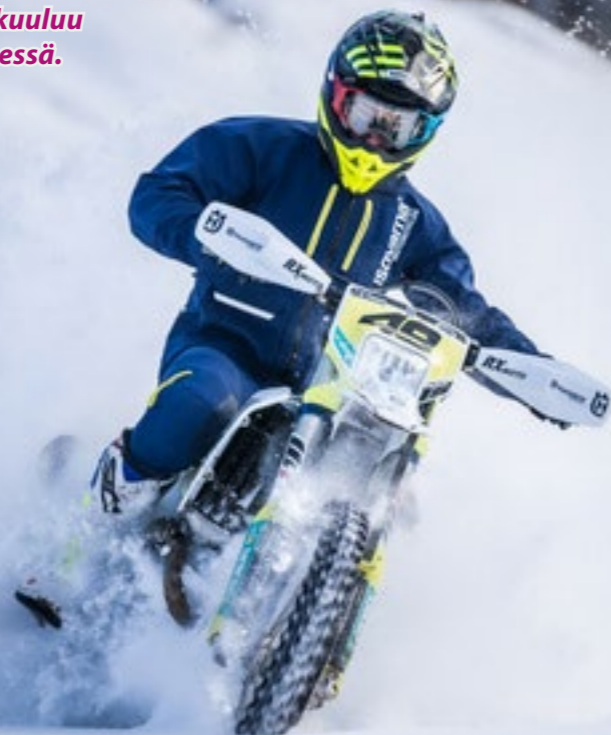
Kaudella 2021 järjestettiin yhteensä 16 endurokilpailua.

Endurokilpailuissa testataan ajajien ja pyörien kykyä selviytyä määritellyistä reiteistä annetun aikataulun puitteissa sekä nopeutta erillisillä maastokokeilla. Kilpailureittiin kuuluu usein siirtymiä yleisessä liikenteessä.