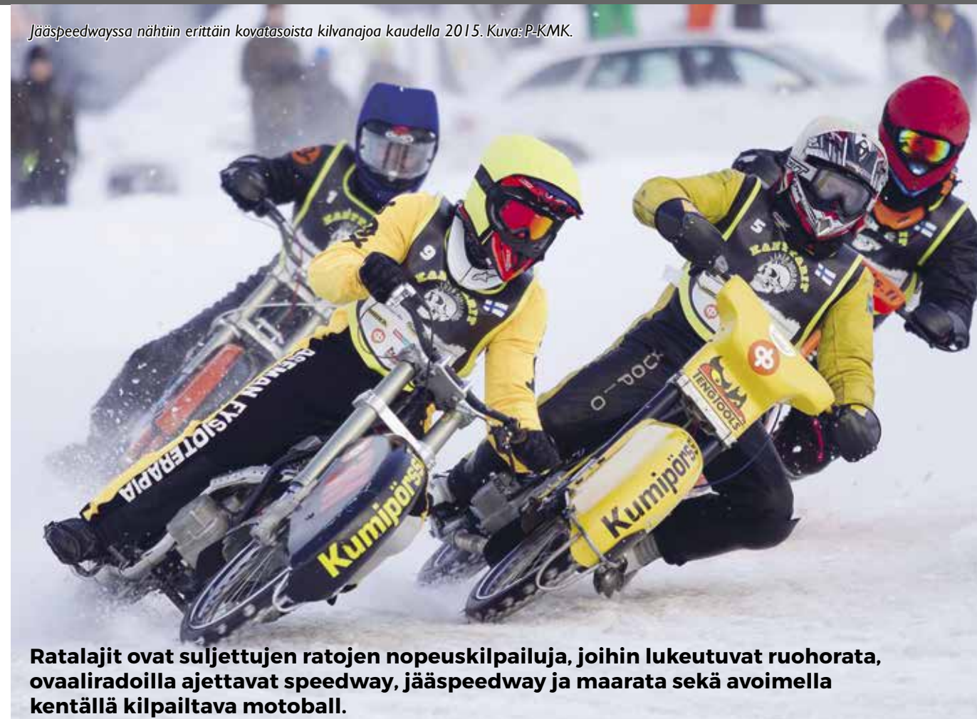
Jääspeedwayssa nähtiin erittäin kovatasoista kilvanajoa kaudella 2015.

Endurokilpailuja järjestettiin vuoden aikana 25 eli kymmenen enemmän kuin edellisenä vuonna. Ajajia oli 886, eli 168 ajajaa enemmän kuin edellisenä vuonna. Uusia ajajia kaudella 2015 oli