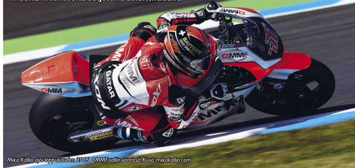
Mika Kallio ajoi loppukauden 2015 @MMF-tallin väreissä.

Road Racing on moottoripyörien nopeuskilpailu, joka ajetaan muulta liikenteeltä suljetulla asfalttiradalla.