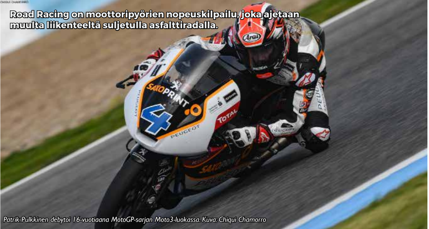
Patrik Pulkkinen debytoi 16-vuotiaana MotoGP-sarjan Moto3-luokassa.

Road Racing on moottoripyörien nopeuskilpailu, joka ajetaan muulta liikenteeltä suljetulla asfalttiradalla.