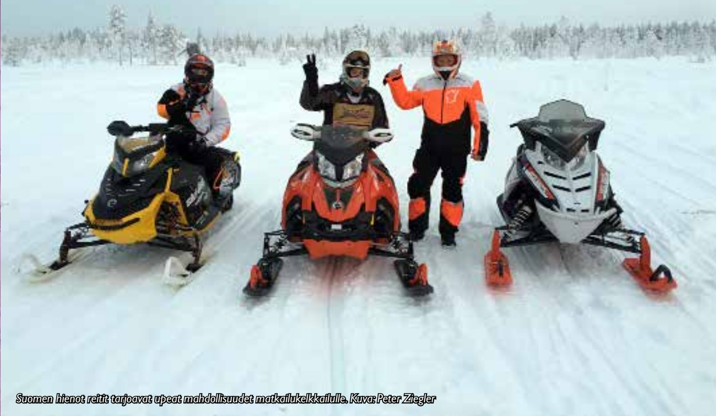
Suomen hienot reitit tarjoavat upeat mahdollisuudet matkailukelkkailulle.

MK-matkailun lajiryhmä pyrkii toiminnallaan tukemaan moottorikelkkailua harrastuksena sekä edesauttamaan moottorikelkkailuun vaikuttavan lainsäädännön laatimisessa, seuraa kaavoituksen kehittymistä alueellisesti sekä pyrkii olemaan alusta asti mukana matkailukeskusten liikenteen suunnittelussa.