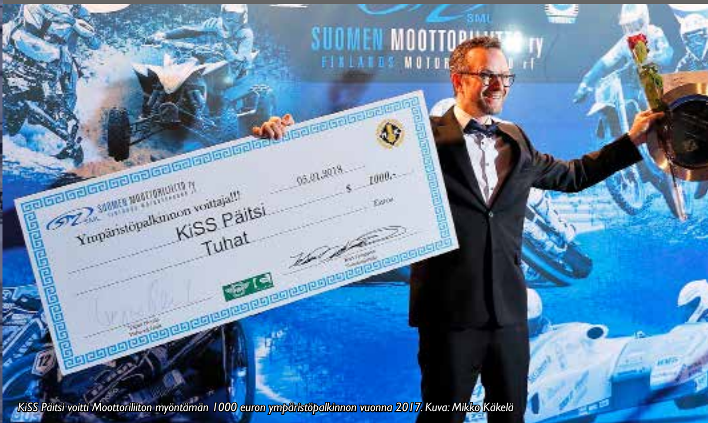
KiSS Päitsi voitti Moottoriliiton myöntämän 1000 euron ympäristöpalkinnon vuonna 2017.