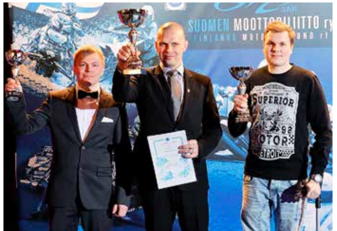
Suomen Moottoriliiton Gala 2017.