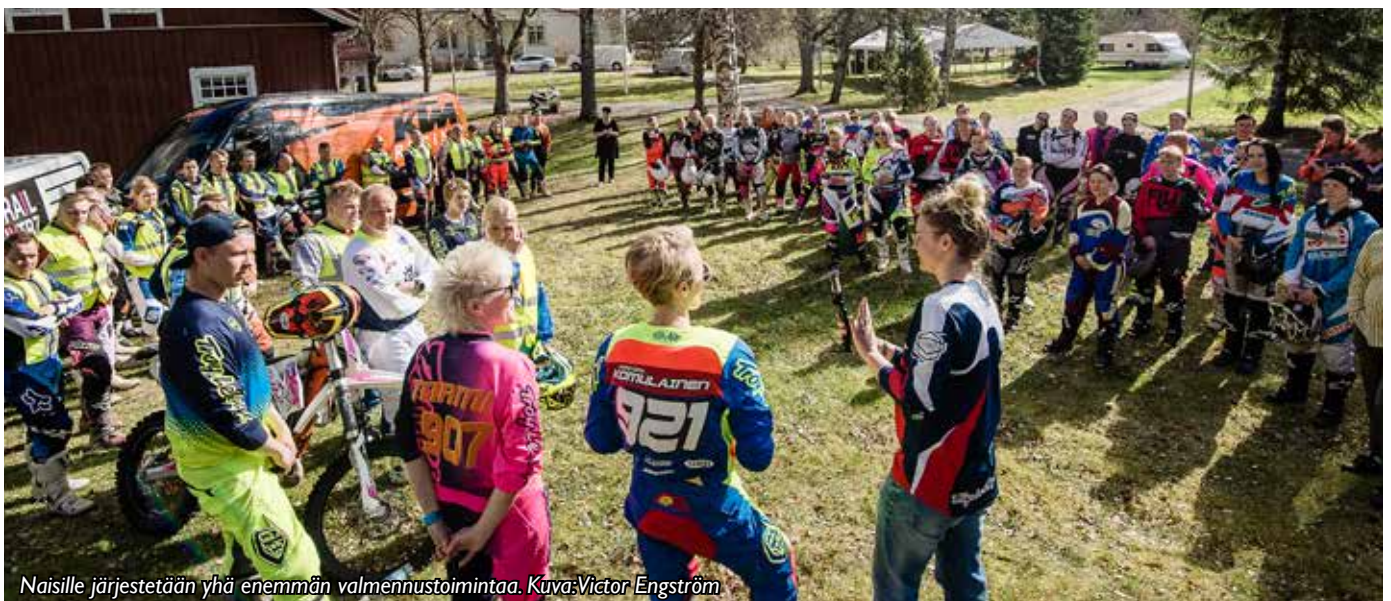
Naisille järjestetään yhä enemmän valmennustoimintaa.

syyskuuhun. Aluevalmennuskonseptille näyttää syntyneen jatkuvuus ja tavoitteena on saada valmennuksen konsepti laajentumaan valtakunnalliseksi toiminnaksi.