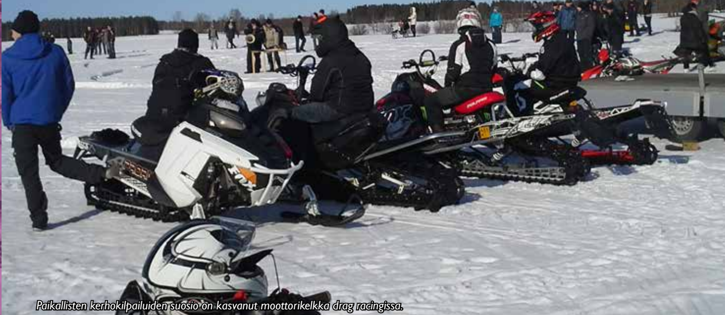
Paikallisten kerhokilpailuiden suosio on kasvanut moottorikelkka drag racingissa.

Moottorikelkka-Drag Racing on kiihdytyskilpailu, joka ajetaan suljetulla, pääsääntöisesti lumeen tampatulla radalla.