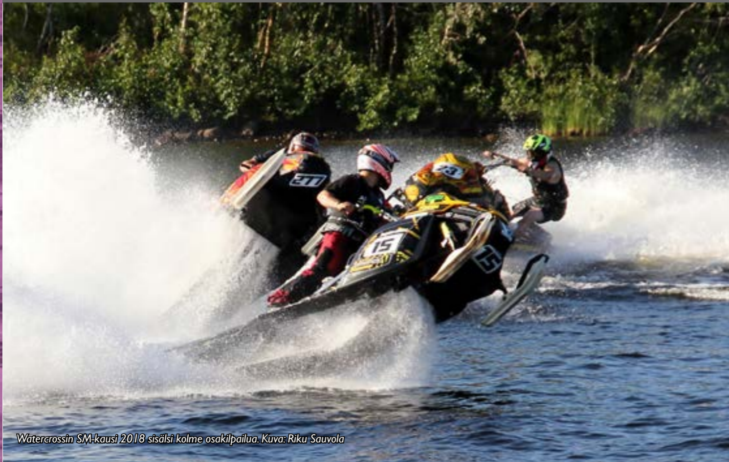
Watercrossin SM-kausi 2018 sisälsi kolme osakilpailua.