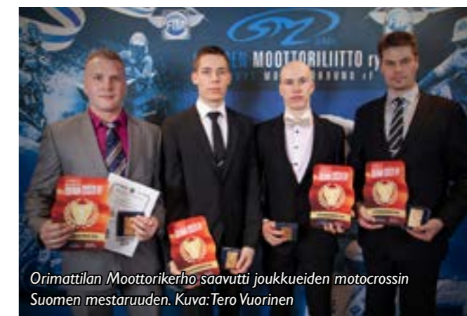
Orimattilan Moottorikerho saavutti joukkueiden motocrossin Suomen mestaruuden.