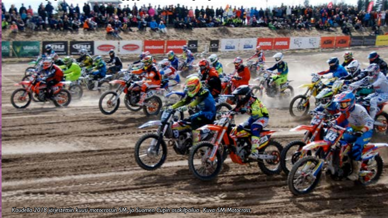
Kaudella 2018 järjestettiin kuusi motocrossin SM- ja Suomen Cupin osakilpailua.

Motocross on suljetulla kilpailualueella ajettava laji, jossa kisataan luonnonmukaisella alustalla ja johon kuuluvat hyppyrat, urat sekä ylä- ja alamäet.