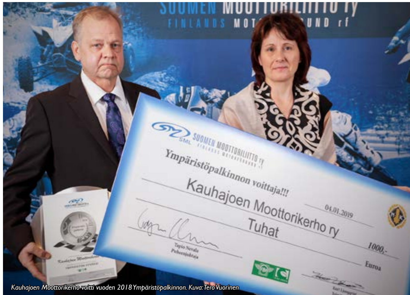
Kauhajoen Moottorikerho voitti vuoden 2018 Ympäristöpalkinnon.