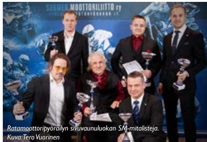
Ratamoottoripyöräilyn sivuvaunuoluokan SM-mitalisteja.