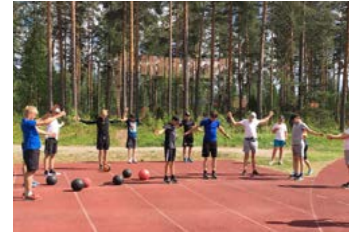
SML Riders Academyn valmennusta.

Joulukuussa pidettiin Olympiakomitean (OK) kanssa tapaaminen, jossa käytiin läpi SML:n valmennuksen tilanne. Kartoituksessa havaittiin, että valmennustoimintamme kokonaisuus on hyvällä tasolla, mutta se ei vastaa OK:n asettamia huippu-urheilun tavoitteita eikä ole sen perusteella tukikelpoinen. Palautteen perusteella valmennusstrategiaa muutettiin vastamaan paremmin OK:n tavoitteita ja samalla havaittiin, että suurimmat puutteet olivatkin pääasiassa raportoinnin täsmentäminen ja urheilijoiden valmennustietojen saattaminen OK:n Pulssi-nimiseen tietojärjestelmään.