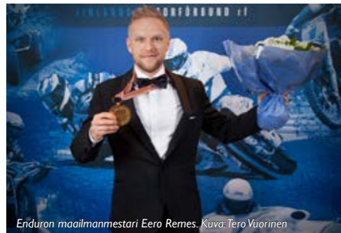
Enduron maailmanmestari Eero Remes.