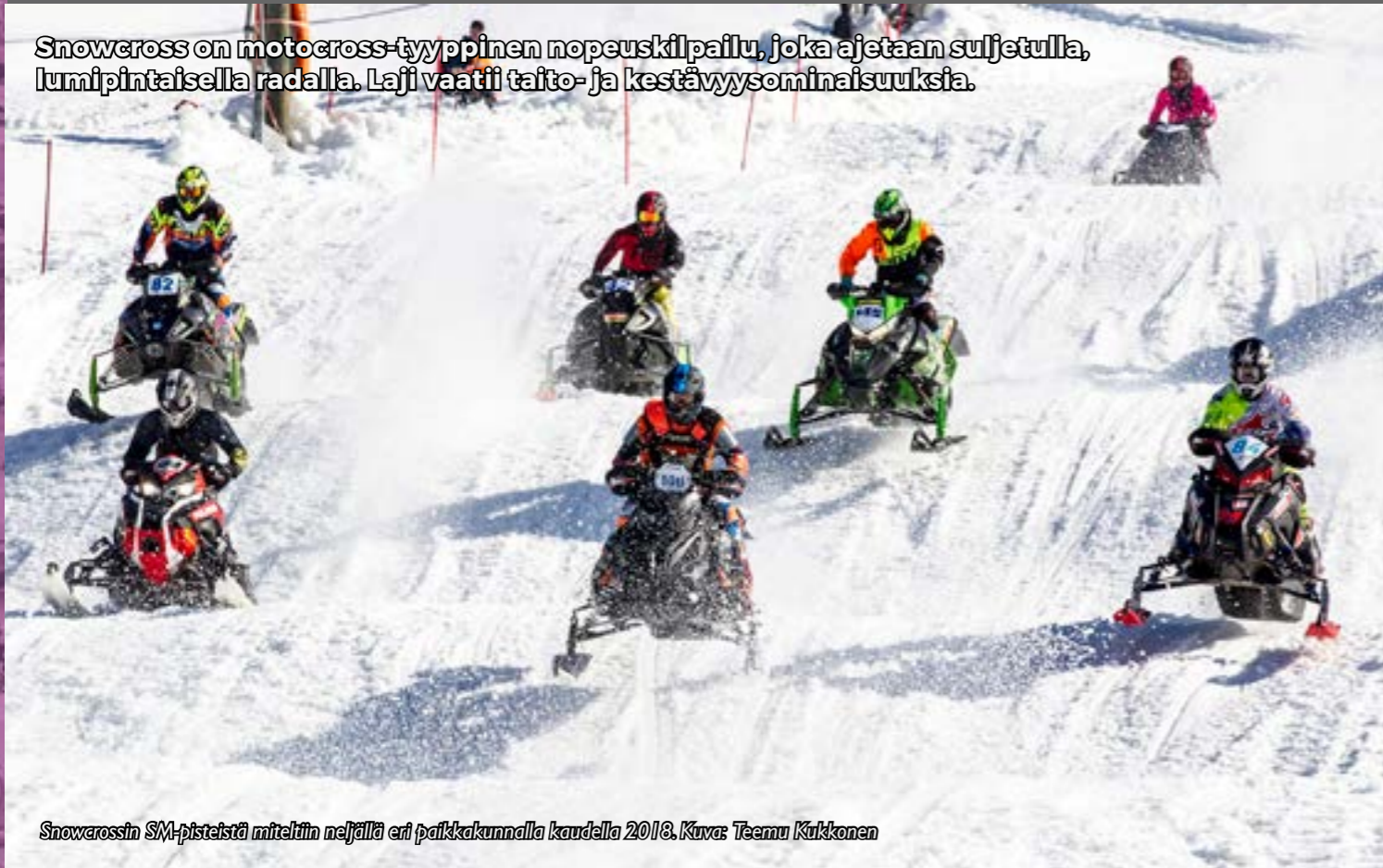
Snowcrossin SM-pisteistä miteltiin neljällä eri paikkakunnalla kaudella 2018.

Snowcross on motocross-tyyppinen nopeuskilpailu, joka ajetaan suljetulla, lumipintaisella radalla. Laji vaatii taito- ja kestävyysominaisuuksia.