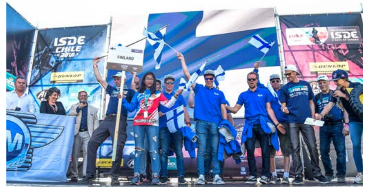
Suomi osallistui enduron MM-joukkuekilpailuun nuorten joukkueella, joka sijoittui kahdeksanneksi.

Vuoden endurokilpailuna palkittiin Päijänteen ympäriajo (HMK)