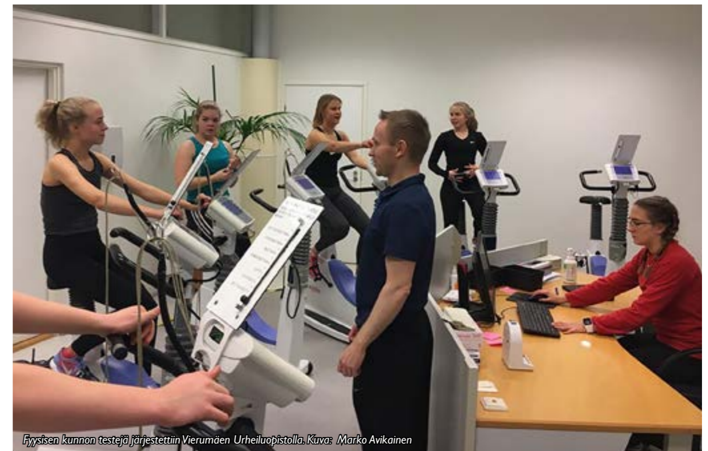
Fyysisen kunnan testejä järjestettiin Vierumäen Urheiluopistolla.