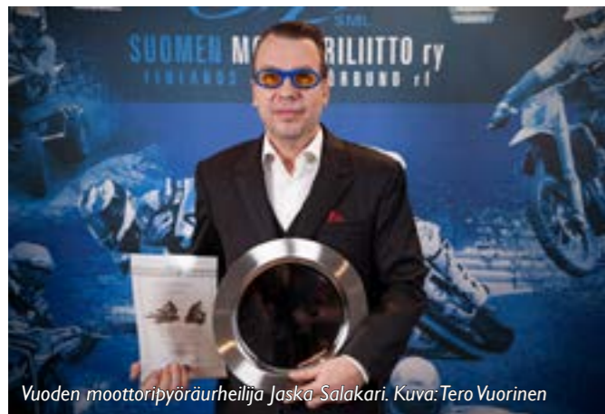
Vuoden moottoripyöräurheilija Jaska Salakari.