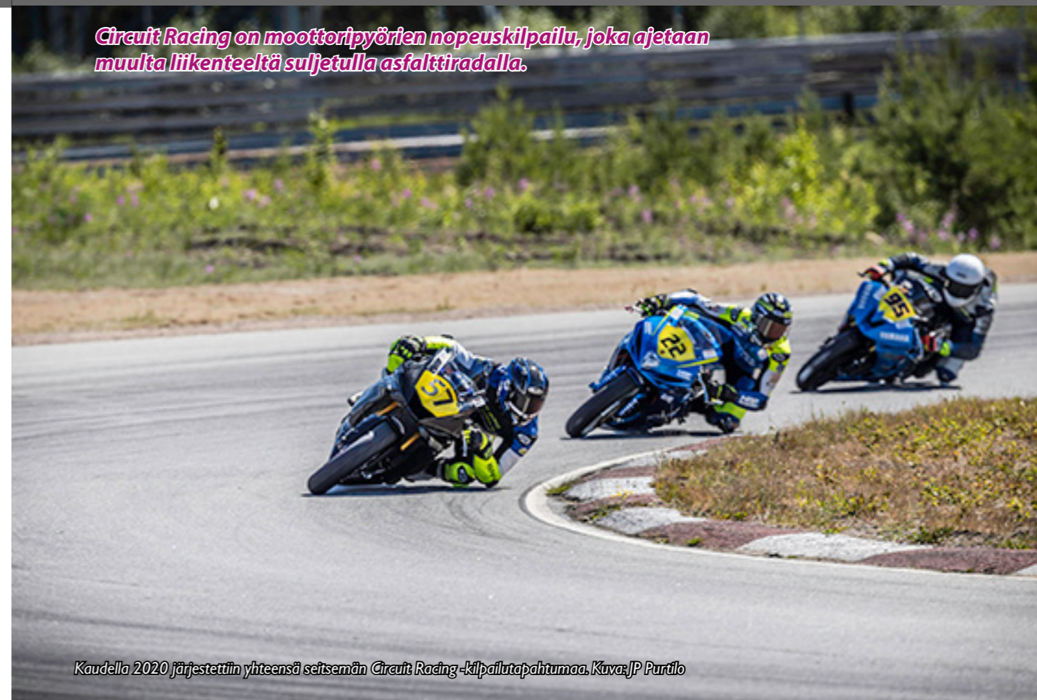
Kaudella 2020 järjestettiin yhteensä seitsemän Circuit Racing -kilpailutapahtumaa.

Circuit Racing on moottoripyörrien nopeuskilpailu, joka ajetaan muulta liikenteeltä suljetulla asfalttiradalla.