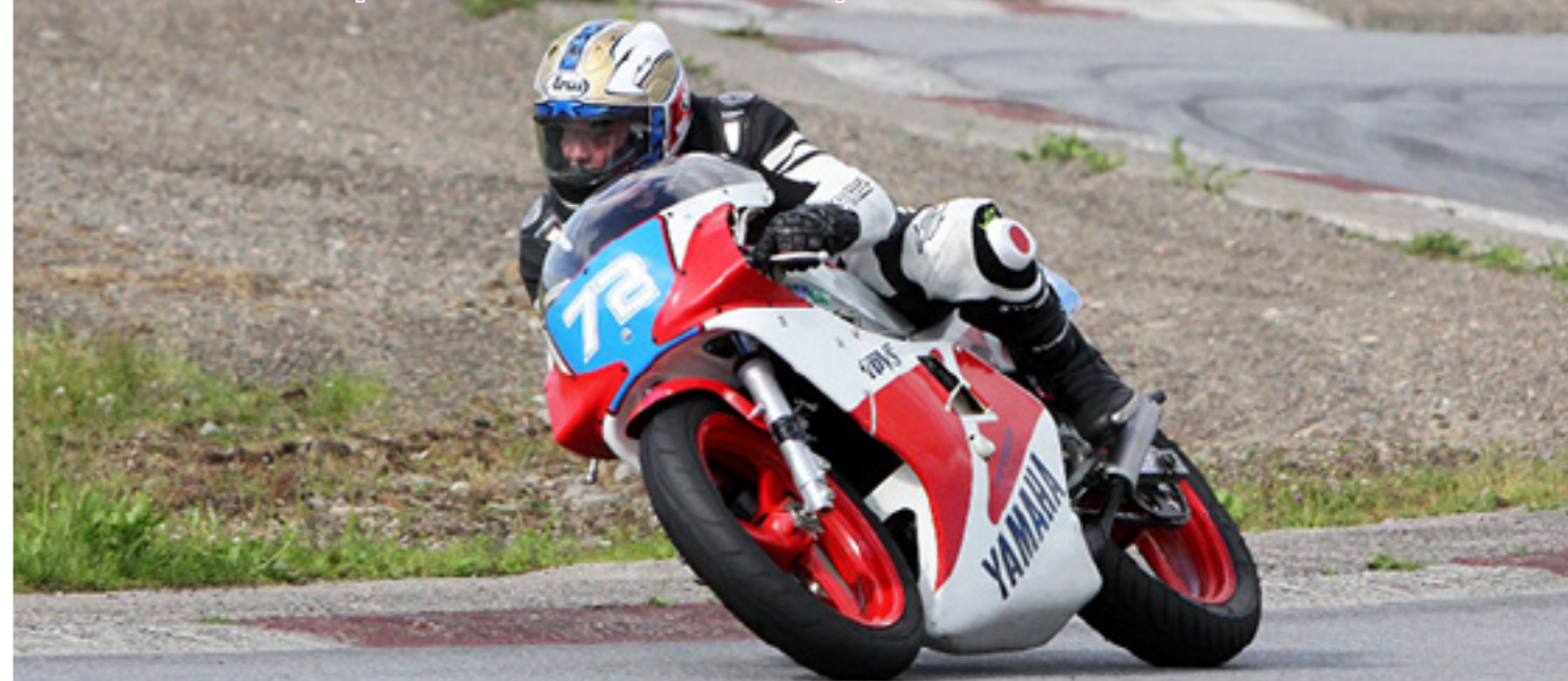
TT- ja RR-historiaa esitellään näytös- ja muistoajoissa.

Classic TT ja RR on alunperin syntynyt tarpeesta taltioida TT- ja RR-kilpailuiden historiaa. Tämä perinnetalennus sisältää itse kilpailutapahtumiin, ajajiin, mekaanikkoihin, toimihenkilöihin ja kalustoon liittyvien historiallisten materiaalien taltiointia. Painopistealueena on suomalainen kilpailuhistoria.