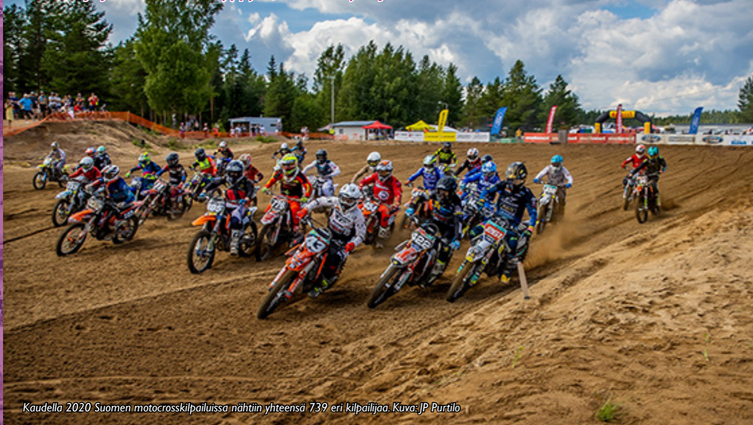
Kaudella 2020 Suomen motocrosskilpailuissa nähtiin yhteensä 739 eri kilpailijaa.

Motocross on suljetulla kilpailualueella ajettava laji, jossa kisataan luonnonmukaisella alustalla johon kuuluvat hyppyrit, urat sekä ylä- ja alamäet.