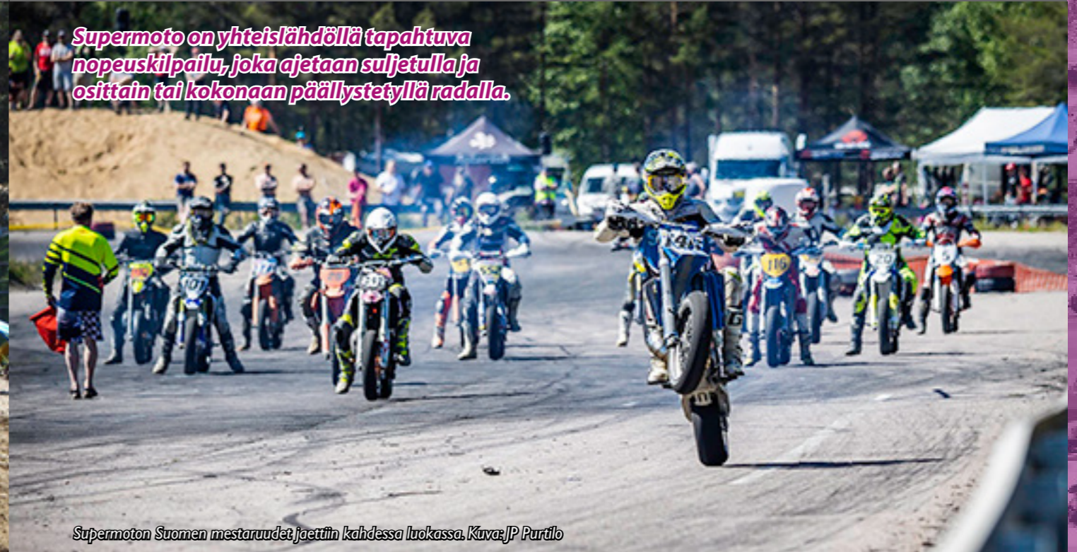
Supermoton Suomen mestaruudet jaettiin kahdessa luokassa.

Supermoto on yhteislähdöllä tapahtuva nopeuskilpailu, joka ajetaan suljetulla ja osittain tai kokonaan päällystetyllä radalla.