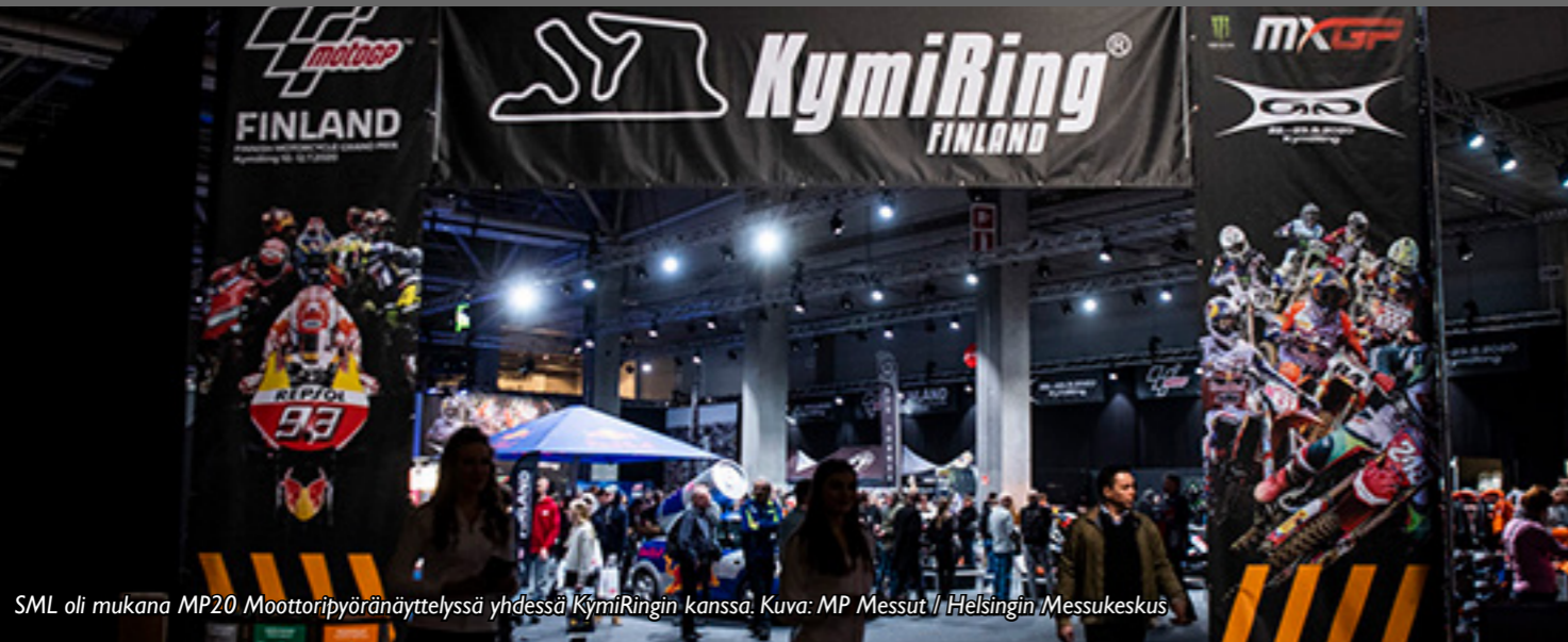
SML oli mukana MP20 Moottoripyöränäyttelyssä yhdessä KymiRingin kanssa.