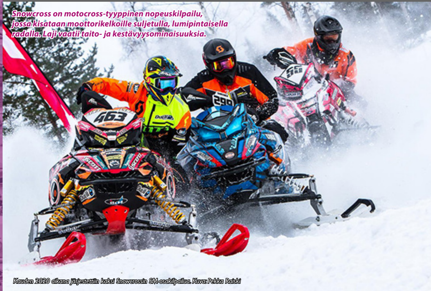
Kauden 2020 aikana järjestettiin kaksi Snowcrossin SM-osakilpailua.

Snowcross on motocross-tyyppinen nopeuskilpailu, jossa kisataan moottorikelkoille suljetulla, lumipintaisella radalla. Laji vaatii taito- ja kestävyysominaisuuksia.