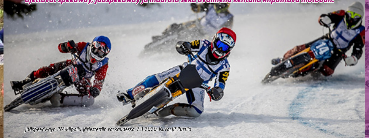
Jääspeedwayn PM-kilpailu järjestettiin Varkaudessa 7.3.2020.

Ratalajit ovat suljettujen ratojen nopeuskilpailuja, joihin lukeutuvat ruohorata, ovaaliradoilla ajettavat speedway, jääspeedway ja maarata sekä avoimella kentällä kilpailtava motoball.