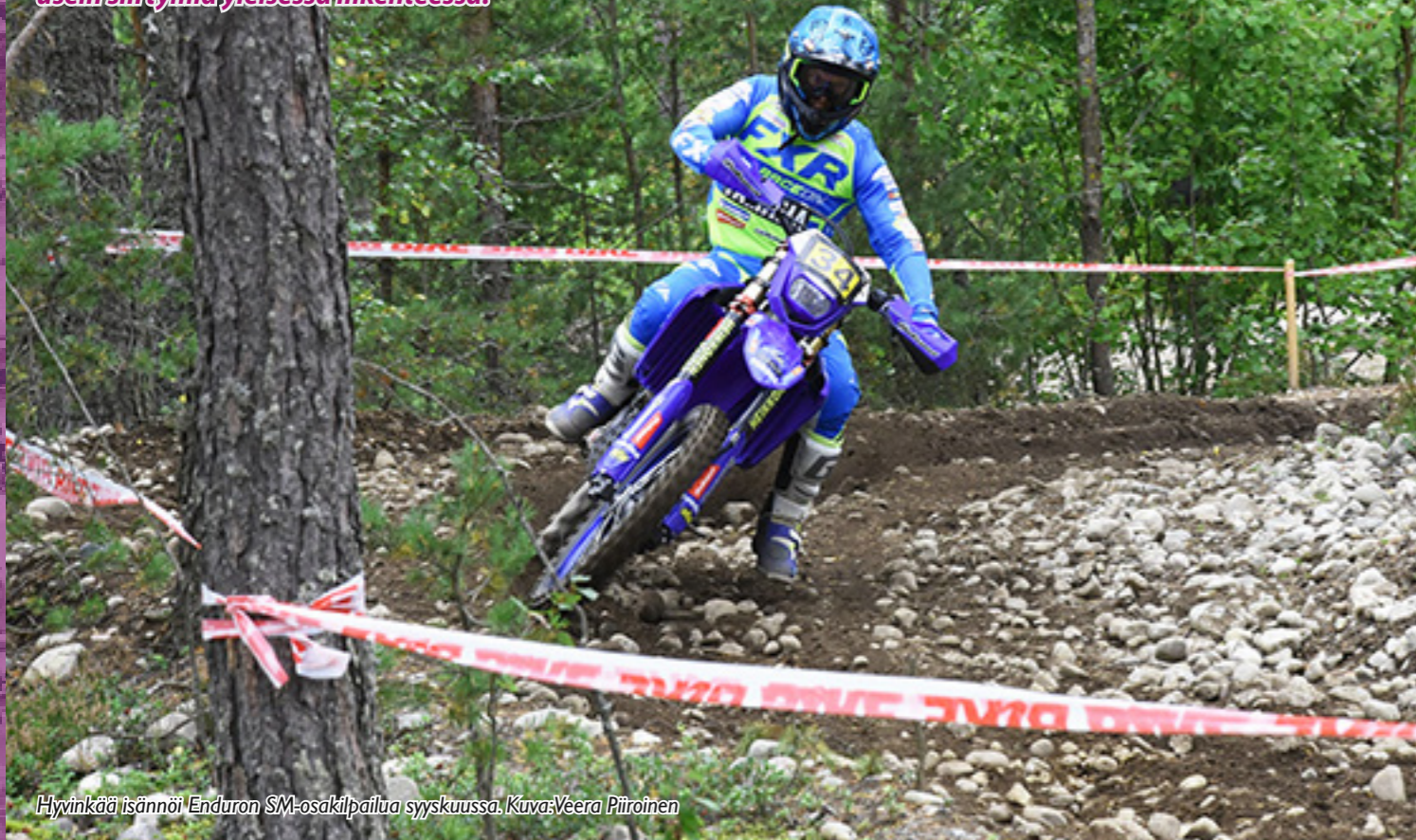
Hyvinkää isännöi Enduron SM-osakilpailua syyskuussa.

Endurokilpailuissa testataan ajajien ja pyörien kykyä selviytyä määritellyistä reiteistä annetun aikataulun puitteissa sekä nopeutta erillisillä maastokokeilla. Kilpailureittiin kuuluu usein siirtymiä yleisessä liikenteessä.