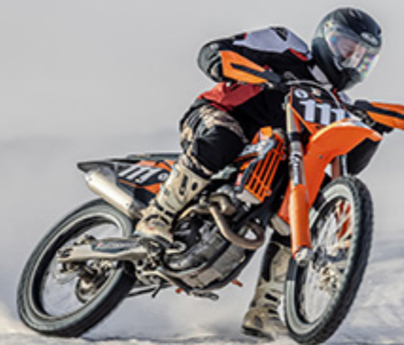
SM-jääratakausi 2020 piti sisällään vain yhden osakilpailun huonojen keliolosuhteiden takia.

Jäärataa ajetaan suljetulla radalla motocross-moottoripyöriin perustuvilla ja erikoisnastoitetuilla renkailla varustetuilla ajokeilla. Lajille ominainen piirre on, että lähtöviivalla kohtaavat eri moottoripyörälajien edustajat.