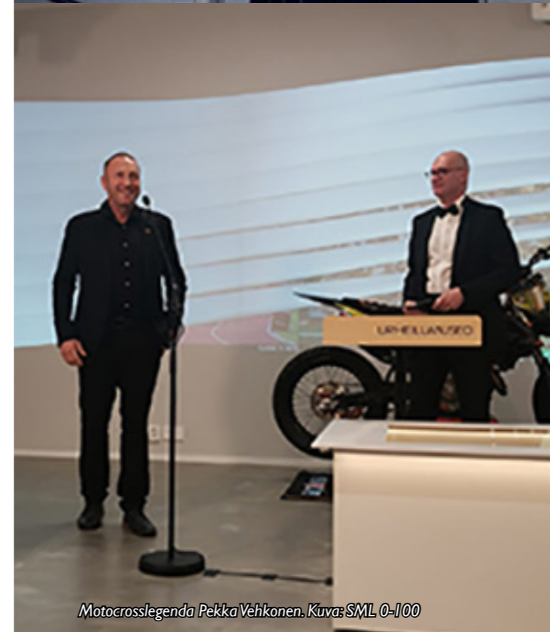
Motocrosslegenda Pekka Vehkonen.