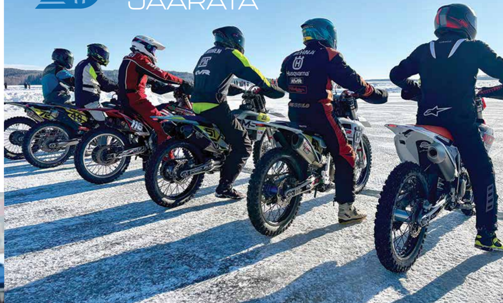
Maaradan SM-finaali ajettiin Teivon raviradalla.