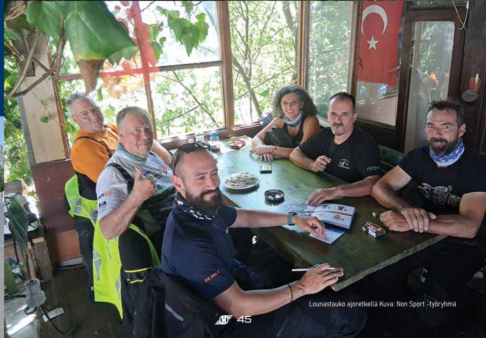
Lounastauko ajoretkellä