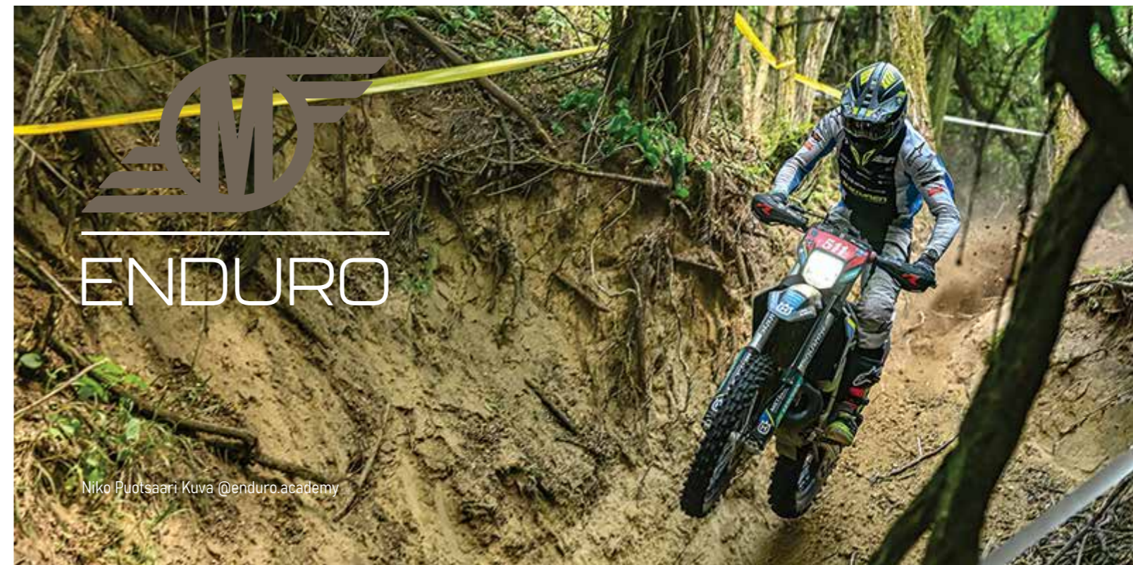
Niko Puotsaari Kuva @enduro.academy

Vuoden endurokilpailuna palkittiin Orimattilan Moottorikerhon 9.8.2025 järjestämä SML 60. Toukokuunajo 2025.