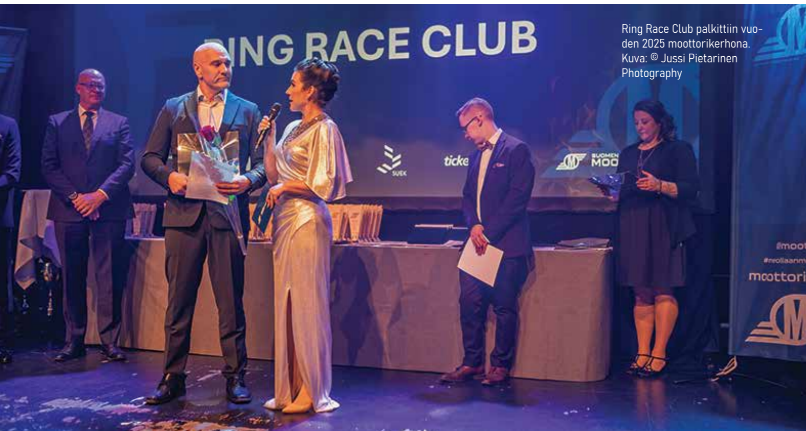
Ring Race Club palkittiin vuoden 2025 moottorikerhona.