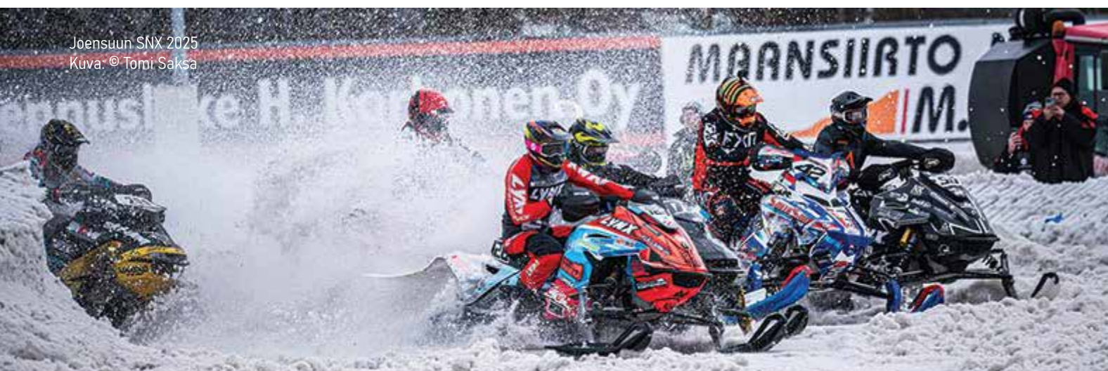
Joensuun SNX 2025

15.-16.03.2025 Mikkelin Moottorikerho ry 05.-06.04.2025 Lapin Moottorikelkkailijat ry