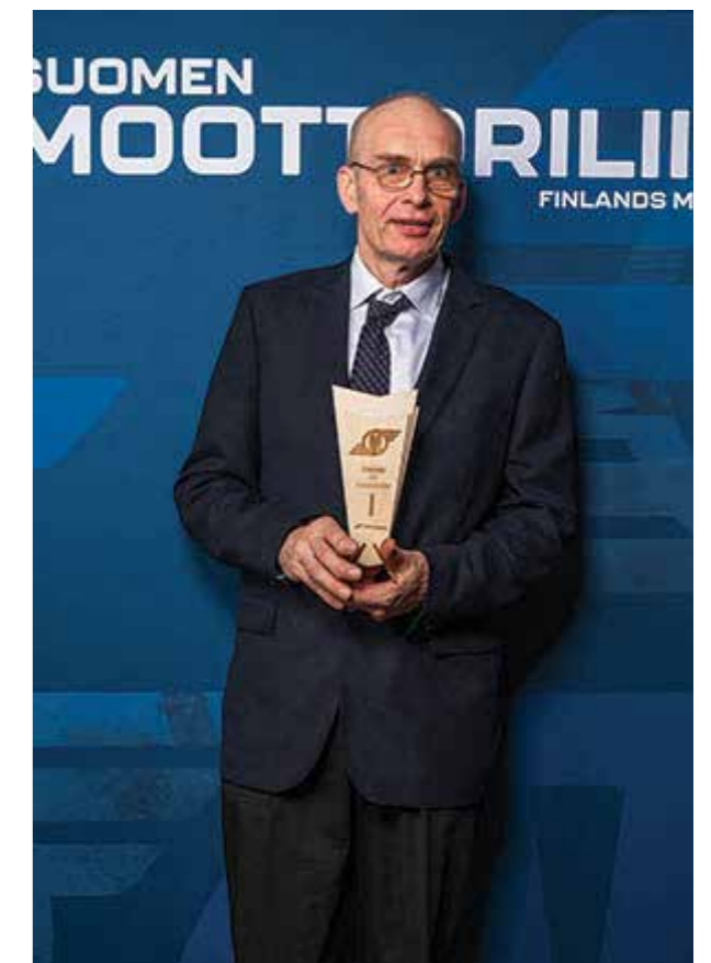
Enduro V60 Suomen Cup 2025 voittaja.