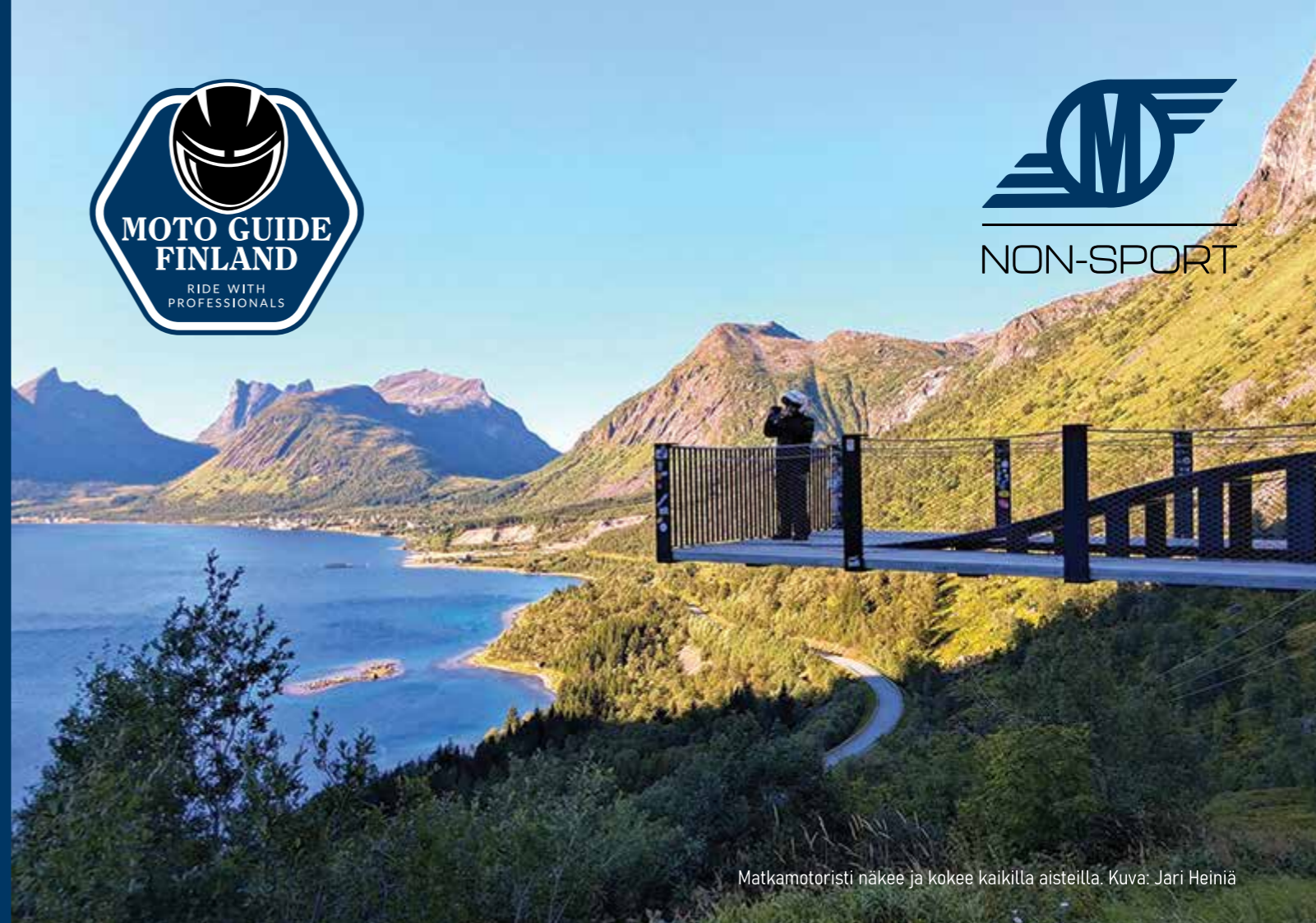
Matkamotoristi näkee ja kokee kaikilla aisteilla.