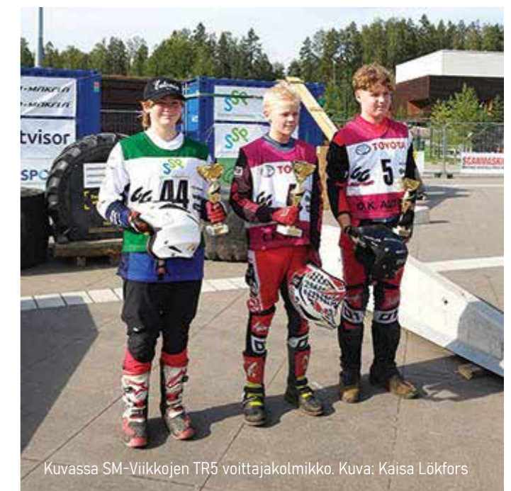
Kuvassa SM-Viikkojen TR5 voittajakolmikko.

Kilpailu: 27.07.2025 Riihimäen Enduroseura ry