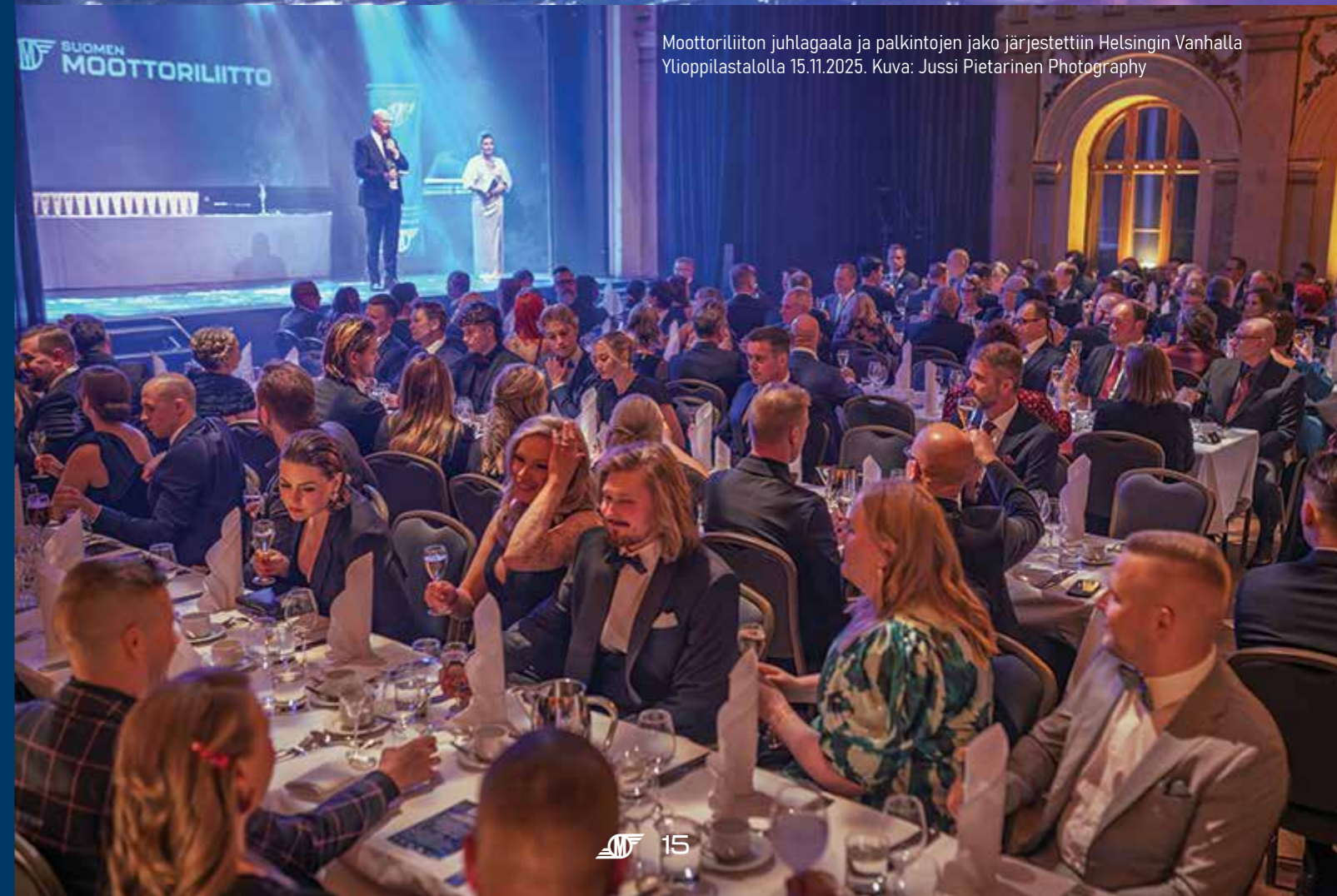
Moottoriliiton juhлагаala ja palkintojen jako järjestettiin Helsingin Vanhalla Ylioppilastalolla 15.11.2025.