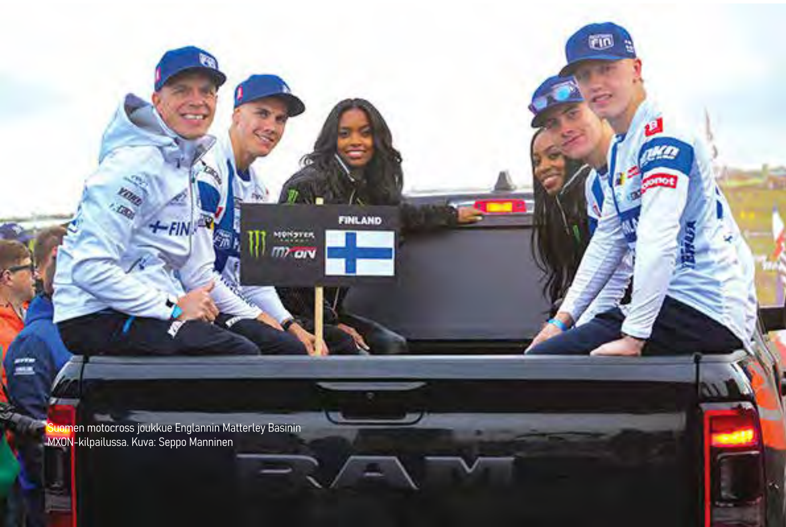
Suomen motocross joukkue Englannin Matterley Basinin MXON-kilpailussa.